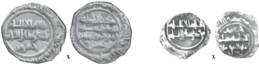
La PV 205 de la Col·lecció Tonegawa

Malauradament la fotografia de la peça de la RAH no permet llegir amb suficient precisió les llegendes per poder donar per certa la descripció. De fet, la moneda hi apareix catalogada com a V 1325 i PV 204, clarament de manera errònia, atès que les llegendes anotades per Vives i Prieto Vives no coincideixen amb aquesta descripció.